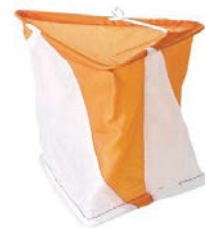
Balise officielle en toile €