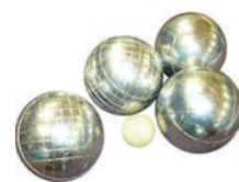
Boules et cochonnet €