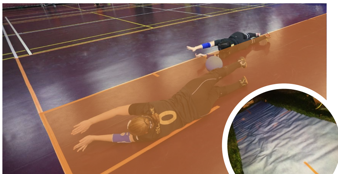
La surface orangée correspond à la zone de défense