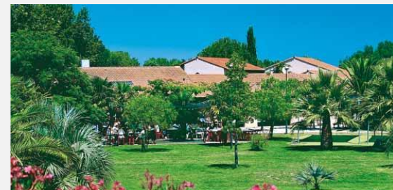
Centre UCPA de Saint-Cyprien

Dates de réunion des commissions de sélection : 18 avril et 9 mai 2017. Lorsque toutes les places sont attribuées, les commissions ultérieures sont annulées.