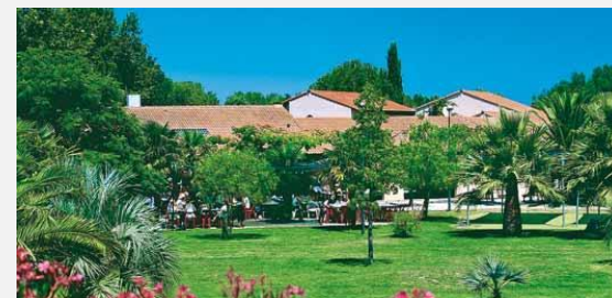
Centre UCPA de Saint-Cyprien

Dates de réunion des commissions de sélection : 18 avril et 9 mai 2017. Lorsque toutes les places sont attribuées, les commissions ultérieures sont annulées.